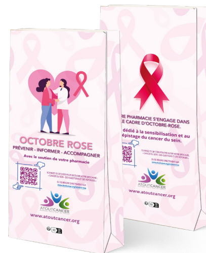
Sac « Octobre-Rose » pour les pharmacies Papier Kraft 40 gr Dimension 18 x 9,5 x 32 cm Avec soufflets