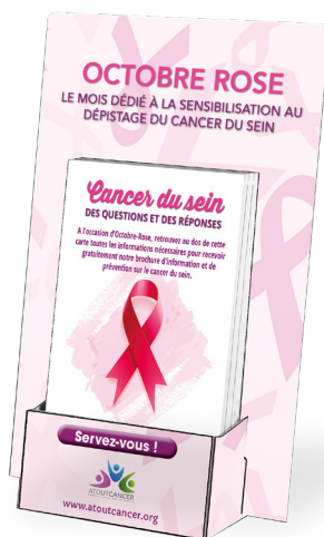
« Présentoir carte » Dimensions 14,8 x 32 cm