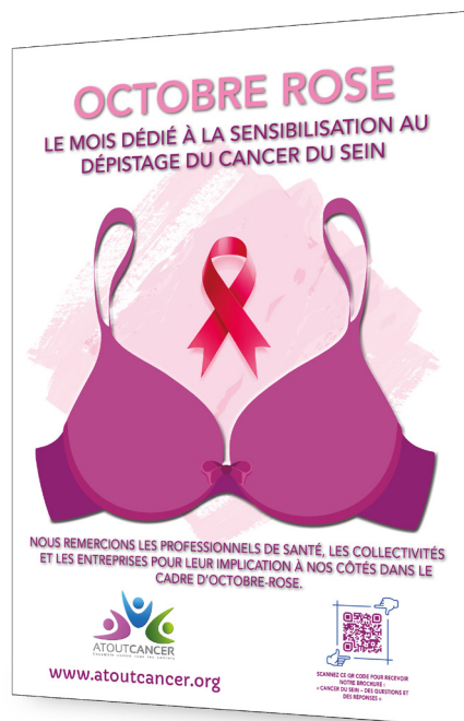
« Affiche A3 » Format 29,7 x 42 cm