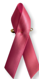
Ruban Rose tissu avec épingle de sureté Format 7,5 cm x 4 cm Conditionné par boîte de 100 et 200 ex.