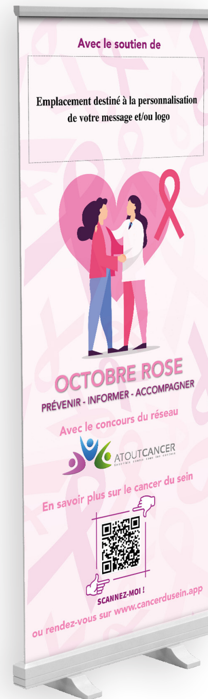
« Roll-up personnalisable » Dimensions 84 x 204 cm