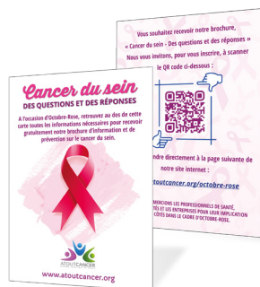
« Carte avec QR code » Format 10,5 x 14,8 cm.